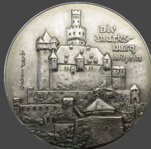
Marksburg von Bodo Ehardt