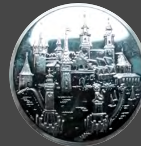
Stadt Lindau / Bodensee