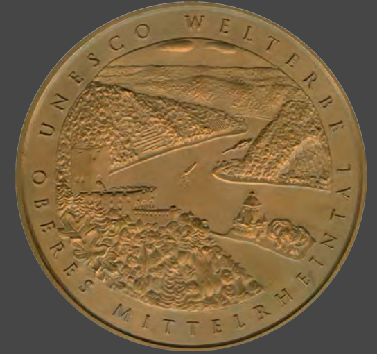
Oberes Mittelrheintal