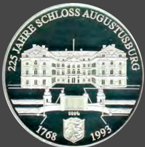
Brühl, Schloss Augustusburg