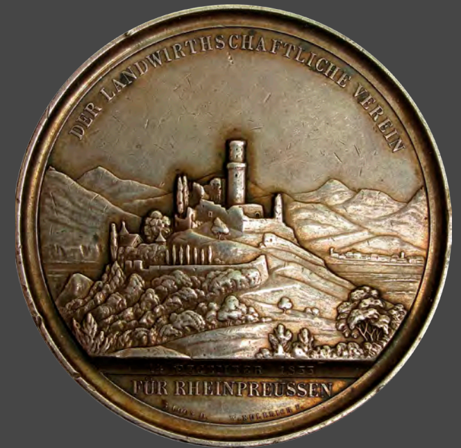
Godesburg vor dem Siebengebirge

Ausstellung der Numismatischen Gesellschaft Bonner Münzfreunde e.V.